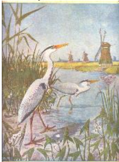
Plaatje uit het boek "lente" uit 1906.

Een stukje tekst uit het boek Lente uit 1906: