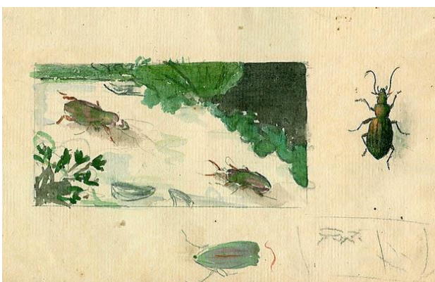
Schets van een tekening voor een "reclameplaatje".

De belangstelling voor de natuur in Nederland kreeg door het uitbrengen van Thijse's Verkade-albums een enorme impuls. De gewone manier van schrijven maakte hem in alle lagen van de bevolking geliefd.